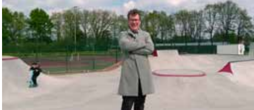
Realisatie skatepark p. 2