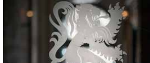
Nieuws uit het Vlaams Parlement p. 3