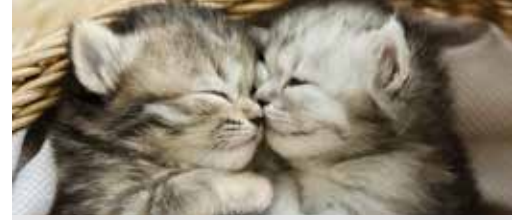
Zele krijgt schepen van Dierenwelzijn (p. 3)