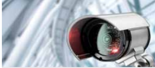
Camera's kosten dubbel zoveel als geraamd (p. 2)