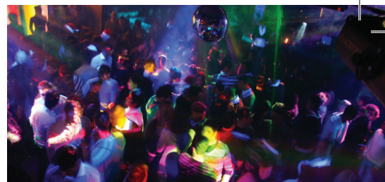
Spannende tijden voor de jeugdsector p. 3