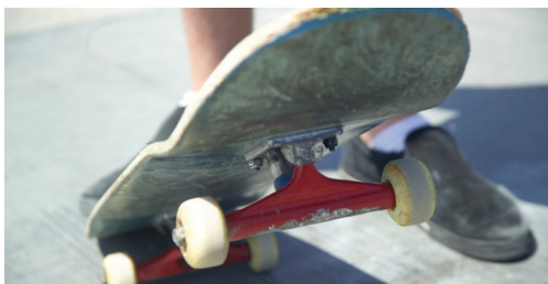
Realisatie skatepark eind deze zomer p. 2